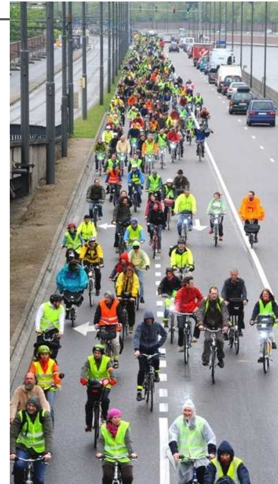
Velo-city 2009 Konferenz in Brüssel